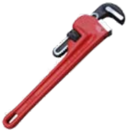
Pipe wrench Llave de tubo