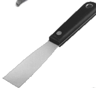
Putty knife Cuchillo para masilla, or espátula