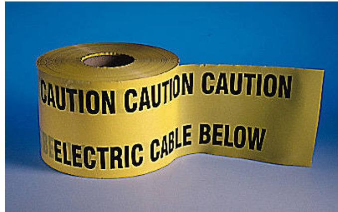
Cinta de aviso