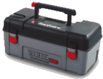
Toolbox Caja de herramientas