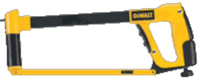
Hack saw Serrucho para metales (I need a hack saw)